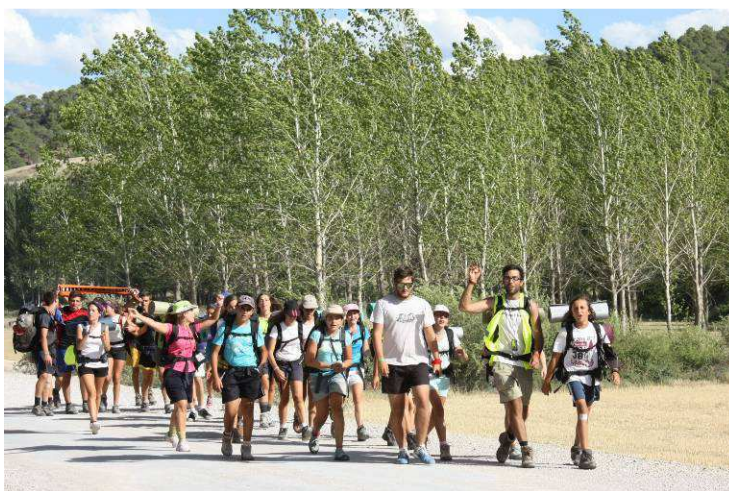
Las Supernovas llegan al campamento.

Montañas, ríos, cañones, barrancos, cuestas, bajadas, valles, picos, noches, días, mucho calor, nada ha podido con este grupo de intrépidos que han atravesado la sierra de Molina con su alegría y su espíritu de juventud.