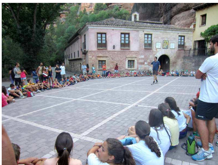
Todos los niños y jóvenes de Sanisi en el Santuario de la Virgen de La Hoz.

Momentos inolvidables para todos nosotros que nos ayudarán para siempre en las situaciones de dolor a lo largo de nuestra vida.