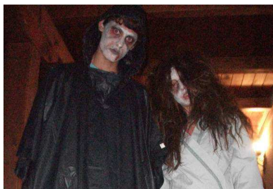
Los premonitores disfrazados de terror.

Las Estrellas Rojas pensaban que la de ayer iba a ser una noche normal, pero no fue así porque unos seres de ultratumba se presentaron súbitamente y con su presencia provocaron el desconcierto, y alguna que otra carcajada, entre los medianos.